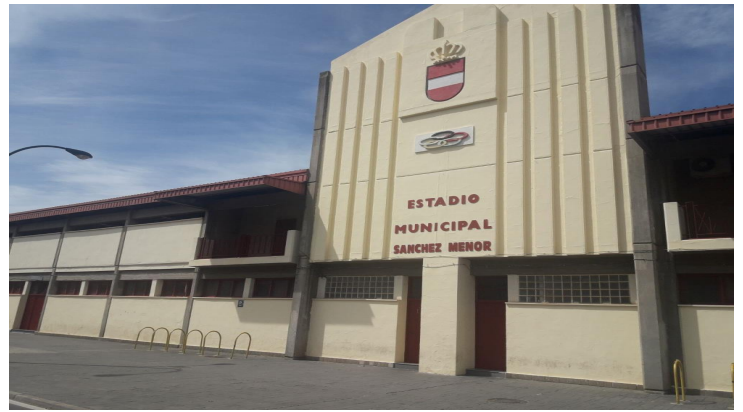
Campo principal de césped natural